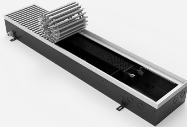
Корпус из оцинкованной стали