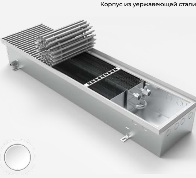
Корпус из нержавеющей стали

140 260 1129-11968 Высота, мм Ширина, мм Теплоотдача, Вт