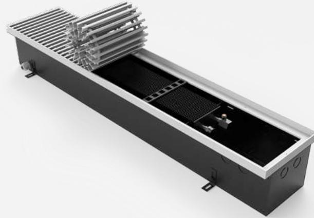
Корпус из оцинкованной стали