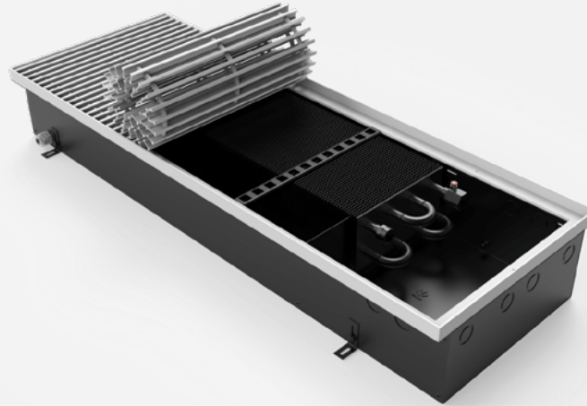
Корпус из оцинкованной стали