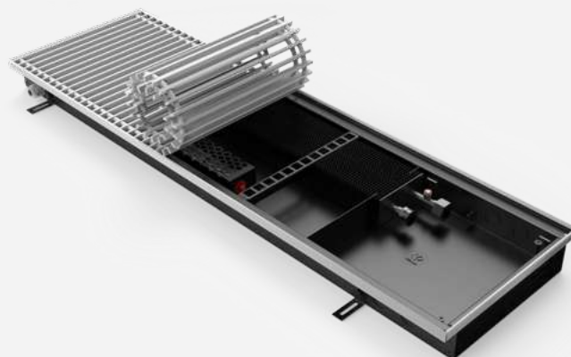
Корпус из оцинкованной стали