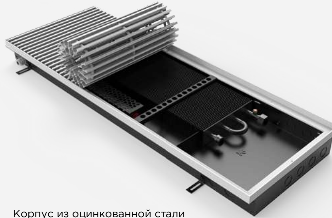
Корпус из оцинкованной стали