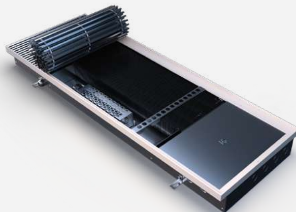
Корпус из оцинкованной стали