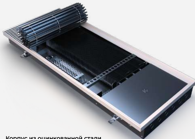
Корпус из оцинкованной стали